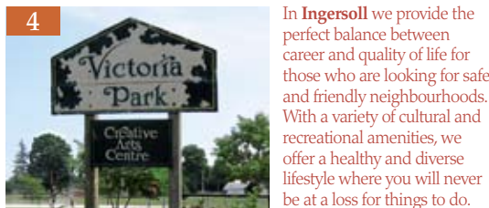
4 INGERSOLL, ONTARIO

L'expérience de Moncton - Les marais littoraux de la baie de Fundy, datant de plusieurs siècles, ont sculpté notre ville et influencé qui nous sommes, pour votre plus grand plaisir. Assistez à des concerts, laissez-vous émouvoir par un ballet, profitez de la meilleure expérience de magasinage au détail au Canada atlantique ou visitez l'un de nos nombreux parcs naturels... Cependant, assurez-vous de bien vous reposer, car chaque jour mène à de nouvelles aventures. www.metromonctonblooms.ca