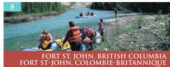
8 FORT ST. JOHN, BRITISH COLUMBIA FORT ST-JOHN, COLOMBIE-BRITANNIQUE

«La porte d'entrée de Muskoka» - Profitez des magnifiques lacs, forêts et grattes de granite naturels de Gravenhurst en visitant un des nombreux parcs et plages publics ou sentiers d'excursion de cette ville située à 170 km au nord de Toronto, dans le bouclier canadien. Faites une croisière à bord du Segwun, le plus ancien navire à vapeur en exploitation en Amérique du Nord, divertissez-vous à l'Opera House centenaire ou magasinez et cassez la croûte au centre-ville historique ou à Muskoka Wharf sur les rives du lac Muskoka. www.gravenhurst.ca