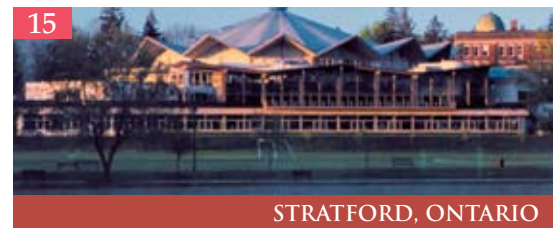
15 STRATFORD, ONTARIO

Oshawa est une ville dynamique de 152 000 habitants, lauréate de plusieurs prix. Située à seulement 40 minutes à l'est de Toronto, elle est blottie entre la plus grande métropole du Canada et la campagne la plus attrayante de l'Ontario. Notre ville est reconnue mondialement comme chef de file et communauté d'avant-garde, où se déroulent des événements passionnants. Oshawa est une magnifique ville quatre fois lauréate de la grande compétition Collectivités en fleurs et récipiendaire d'une médaille d'or des « International Awards for Liveable Communities ». Nos installations récréatives, nos jardins spectaculaires, notre réseau étendu de parcs et notre système de sentiers accessibles ne sont que quelques-uns des services « incroyables » que nous offrons. www.oshawa.ca/tourism/tourism.asp