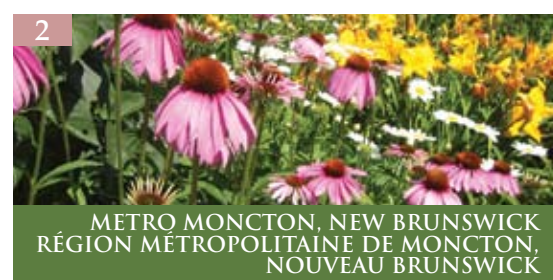
2 METRO MONCTON, NEW BRUNSWICK RÉGION MÉTROPOLITAINE DE MONCTON, NOUVEAU BRUNSWICK

Stratford - Des tapis gazonnés entourent des cygnes glissant le long de la rivière Avon, avec mille acres de parcs et plus de 80 000 plantes annuelles répandues dans toute la ville. Découvrez les plantations patrimoniales des jardins de Shakespeare, les jardins décoratifs formels Arthur Meighen du Festival Theatre et des lits composés de centaines d'iris, l'emblème floral de Stratford. De plus, explorez notre quartier historique, fleurant sous des paniers, kiosques et bouquets de fleurs décorant les terrasses extérieures et les boutiques. Visitez le site www.welcometostratford.com pour des idées florissantes.