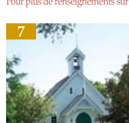
7 VAUGHAN, ONTARIO

Fort St-John , la « Cité de l'énergie », est la plus grande communauté située sur la route historique de l'Alaska, en Colombie-Britannique. Des plaines de terres agricoles à l'infini et de vastes paysages panoramiques entourent notre communauté du Nord. Située dans la magnifique région de la vallée de la Rivière-à-la Paix, la ville effectue 90 % de la production céréalière à l'échelle provinciale. De plus, elle produit 38 % de son énergie hydroélectrique et possède quelques-uns des plus importants gisements de gaz naturel en Amérique du Nord. Le jardin de la ville de Fort St-John dépeint les rivières du nord canadien, les champs de ravissantes fleurs de canola d'un jaune éclatant qu'on trouve en été et le ciel bleu brillant typique du nord-est de la Colombie-Britannique. Pour plus de renseignements sur la « Cité de l'énergie », visitez www.cityfsj.ca .