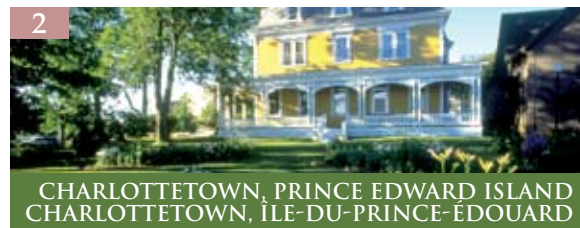
2 CHARLOTTETOWN, PRINCE EDWARD ISLAND CHARLOTTETOWN, ÎLE-DU-PRINCE-ÉDOUARD

Les jardins de la Tour CN ont donné naissance à un jardin de fines herbes où celles-ci approvisionnent la merveilleuse cuisine de 360 le Restaurant de la Tour CN. Deux platebandes de dimensions de 85 pieds sur 7 pieds comptent une vaste gamme d'herbes annuelles et vivaces. Une seule variété de chacune des fines herbes : thym, origan, fenouil et sauge, ainsi que plusieurs variétés de basilic et un vaste assortiment de légumes font l'objet d'une récolte quotidienne. Le jardin de fines herbes représente un autre projet vert de la Tour CN, et chaque effort est important, car nous nous efforçons de « penser dans une perspective mondiale tout en agissant au niveau local » lorsque nous abordons les questions d'ordre environnemental.