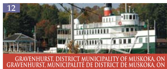
12 GRAVENHURST, DISTRICT MUNICIPALITY OF MUSKOKA. ON GRAVENHURST, MUNICIPALITÉ DE DISTRICT DE MUSKOKA. ON

En 1864, Charlottetown a été l'hôte d'une conférence réunissant des délégués politiques de la région. C'est cet événement historique qui a donné naissance au Canada. Si vous visitez la jolie capitale de l'Île-du-Prince-Édouard aujourd'hui, elle sera tout aussi fertile en événements. Située sur la rive sud, au cœur de l'Île-du-Prince-Édouard, Charlottetown donne sur un port naturel hors pair qui est formé par la jonction de trois importantes rivières. En plus d'être connue sous le nom de « berceau de la Confédération », Charlottetown est le foyer de la comédie musicale « Anne, la maison aux pignons verts », soit la comédie musicale de la planète qui a été présentée le plus longtemps. www.city.charlottetown.pe.ca