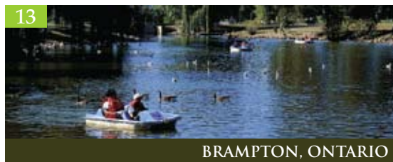
13 BRAMPTON, ONTARIO

La municipalité de Vaughan , dont la croissance est une des plus rapides au Canada, est la première ville à remporter consécutivement des prix dans le cadre du programme Collectivités en fleurs à l'échelle provinciale, nationale et internationale. Notre logo Collectivités en fleurs, affiché dans la Tour CN, rend honneur aux 400 compositions florales qui embellissent notre ville. La municipalité de Vaughan participe aux célébrations Hiver en fête et elle aura l'honneur d'accueillir la conférence nationale de Collectivités en fleurs en 2009. Nous invitons tout le monde à visiter la collectivité florissante qu'est la Ville de Vaughan. www.city.vaughan.on.ca