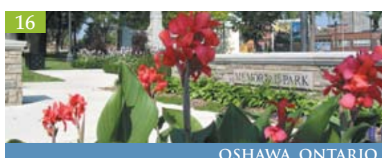
16 OSHAWA, ONTARIO

Bienvenue à la ville de Brampton , où le patrimoine est intégré avec soin à une communauté dynamique et moderne. Se fondant sur la floriculture des années 1860, Brampton est reconnue à l'échelle nationale et internationale comme ville d'une beauté remarquable, associée à une communauté cosmopolite en pleine croissance, représentant plus de 70 cultures différentes. Pour plus de renseignements, visitez le site web www.brampton.ca